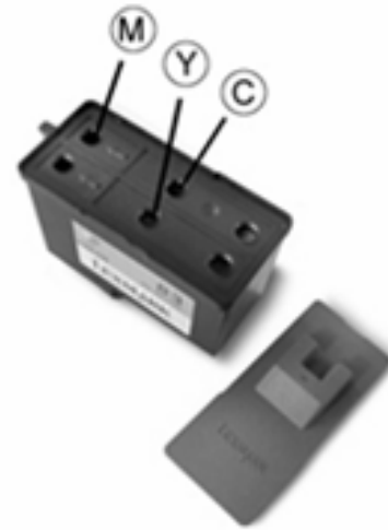
Orificio para llenar