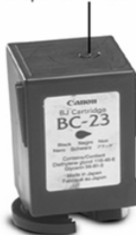
el tapón de ventilación