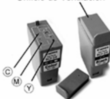
Orificio de Ventilación