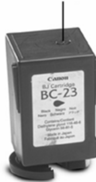
Tapón de Ventilación