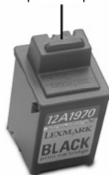
Orifice pour remplissage