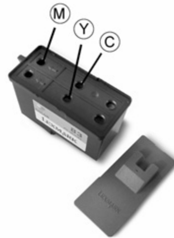
Orifice pour remplissage