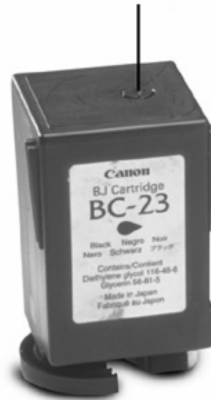
Bouchon de Ventilation