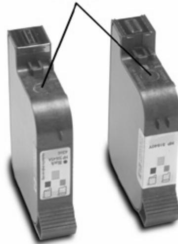
Orifice pour remplissage

NOTE : Si l'encre ne coule pas, placez la tête d'impression sur une serviette en papier humide afin d'attirer l'encre.